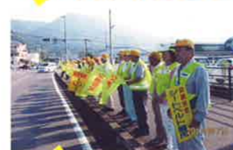
佐伯 街頭啓発活動