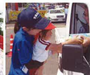
竹田支部 コーン2(交通)安全運動