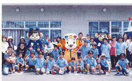
別府支部 ジュニアトラフィックスクール