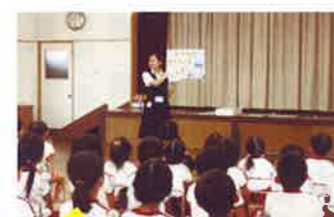
大分東 子どもの交通安全教室