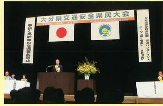
～ 昨年(平成28年)開催状況～

大分県交通安全推進協議会では、9月1日、ホルトホール大分において「平成28年大分県交通安全県民大会」を開催しました。この大会は県民の交通安全意識の高揚と「秋の全国交通安全運動」に対する県民への周知徹底及び同運動の盛り上げを図るとともに、大分県交通安全県民運動(「おこさず あわず 事故ゼロ」)の更なる推進を図ることを目的としたもので約600名が参加しました。