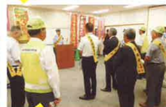
豊後大野 交通安全運動出発式