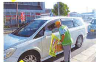
豊後高田 街頭啓発活動