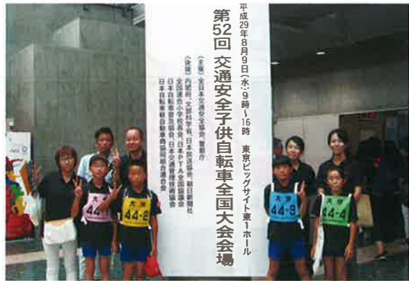
平成29年8月9日(水)9時16分 東京ビッグサイト東1ホール 第52回交通安全子供自転車全国大会会場