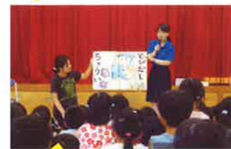
国東 子どもの交通安全教室