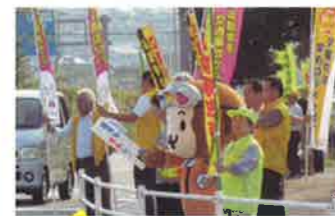
日出 街頭啓発活動