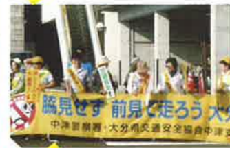
中津 街頭啓発活動