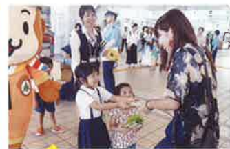
別府 街頭啓発活動