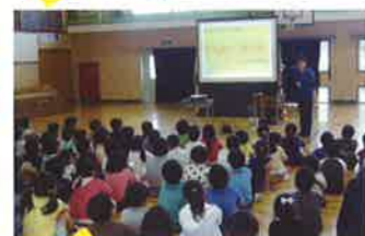
日田 子どもの交通安全教室