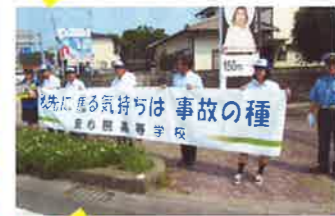
宇佐 高校生交通安全サミット