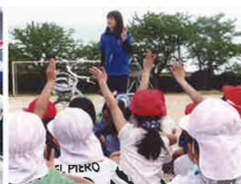
中津支部 (市内小学校)