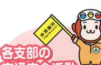
各支部の 交通安全活動