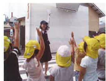
大分南支部 (あなみ保育園)