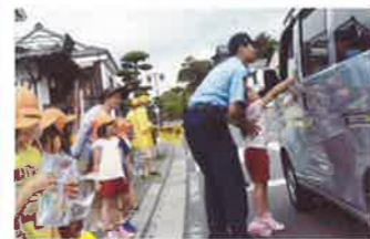
杵築 街頭啓発活動