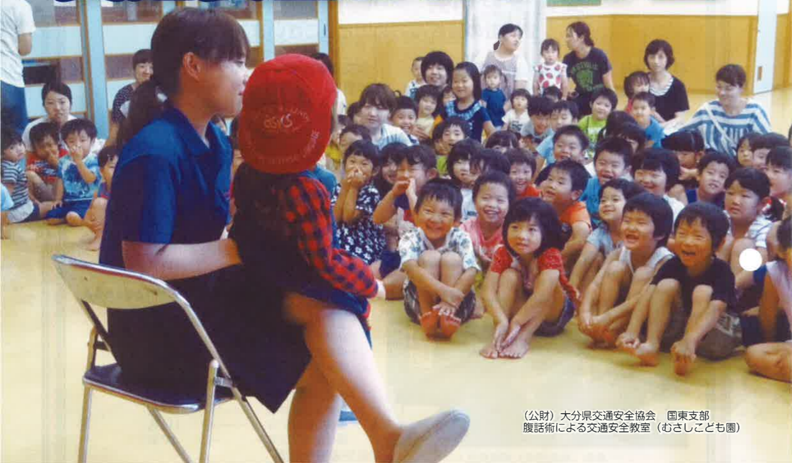
(公財)大分県交通安全協会 国東支部 腹話術による交通安全教室 (むさしこども園)