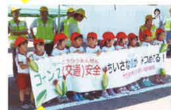
竹田 コーン2(交通)安全活動