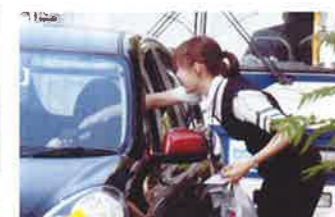
大分中央 街頭啓発活動