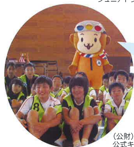
(公財)大分県交通安全協会 公式キャラクター「さるーる」