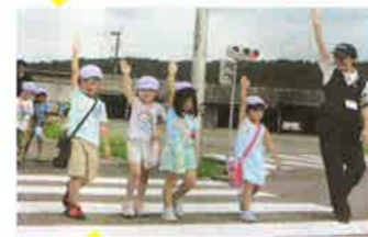
玖珠 子どもの交通安全教室