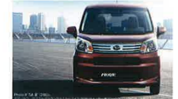
ムーヴカスタムRS「ハイバーSAⅢ」(2WD-CVT) 660cc TURBO